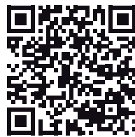
Link zur Herstellersuche