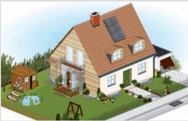
Das gemeinsame "Güte-Haus" des RAL. Auf der Internetseite www.ral.de werden die Gütegemeinschaften rund ums Haus vorgestellt.