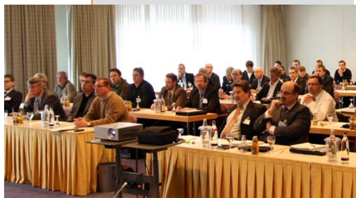
Über 40 Teilnehmer auf der Fachtagung Holz/Metall

In dem Fachbereich Holz und Holz-Metall steht weiterhin die Umsetzung der CE-Kennzeichnung für Holzfenster auf dem Programm. Ein weiterer Schwerpunkt ist der Werkstoff Holz und seine Weiterentwicklung. In Zukunft sollen auch modifizierte Hölzer in die Holzartenliste aufgenommen werden. Am 17. Juni 2008 findet ein Infotag für alle Materialien bei der Firma SIEGENIA-AUBI KG in Wilnsdorf statt.