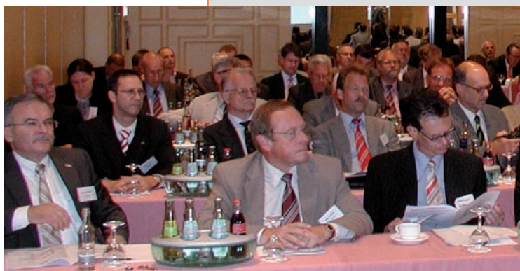
An der Fachveranstaltung Kunststoff nahmen rund 70 Mitglieder teil.

Reduzierte Wanddicke von Kunststoffprofilen, modifizierte Hölzer und statische Dimensionierungen von Profilen und Glas waren die bestimmenden Themen bei den materialspezifischen Veranstaltungen des Hamburger Kongresses. Vor allem die Frage, ob sich die Reduktion der Außenwandstärke von Kunststofffensterprofilen mit dem Qualitätsanspruch der Gütegemeinschaft verbinden lässt, löste lebhafte Diskussionen aus. Die Teilnehmer bei der Podiumsdiskussion über die Holzarten der Zukunft waren sich über die guten Perspektiven für hochwertige Holzfenster einig. In der Fachveranstaltung Metall stand unter anderem die "statische Dimensionierung von Profilen und Glas" auf dem Programm.