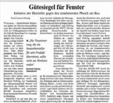
Die Welt, 2. 4. 2008