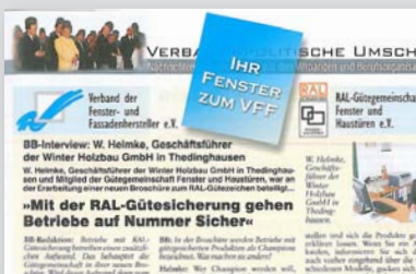
Bauelemente Bau, 4/2008

Das neue RAL-Gütezeichen Montage sowie Hilfen bei der CE-Kennzeichnung stehen auf dem Programm eines werkstoffneutralen Infotags der Gütegemeinschaft Fenster und Haustüren. Der Infotag findet am 17. Juni bei der Firma SIEGENIA-AUBI KG in Wilnsdorf statt. Zunächst informieren Vorträge über das „RAL-Gütezeichen Montage – Abrundung des Qualitätskonzepts!“ und „Wie erstelle ich meine Mustersystembeschreibung richtig?“ Die Erstellung der Mustersystembeschreibung, die Anpassung der werkseigenen Produktionskontrolle sowie die Ermittlung des U w -Werts und R w -Werts werden in parallel laufenden Workshops praktisch geübt. Ab 19 Uhr sind alle Teilnehmer zu dem „SIEGENIA-AUBI-Abend“ mit Live-Übertragung des EM-Spiels Frankreich gegen Italien eingeladen. Am zweiten Tag der Gemeinschaftsveranstaltung von Gütegemeinschaft und ift ist die Holzfachtagung unter dem Titel „Holzfenster – fit für die Energieeinsparverordnung?“ angesetzt. Dabei geht es um Chancen und Potenziale zukünftiger Holzfensterkonstruktionen.